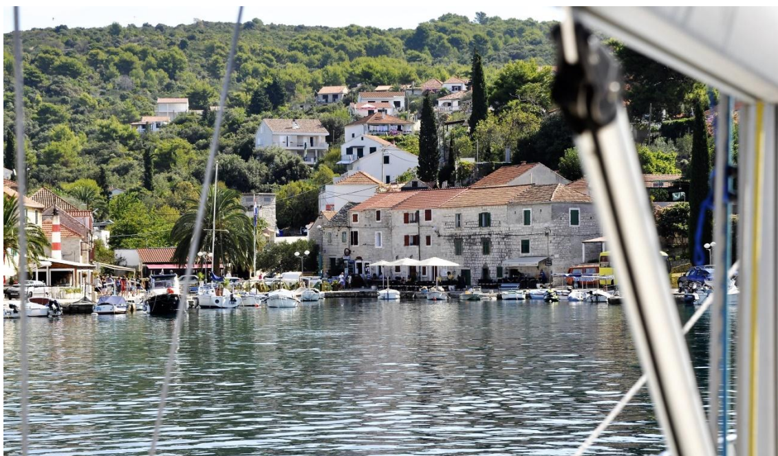
Proa Itaca – Etapa 6: Travesía 2016 - 2017

Split resulta la mejor joya de Croacia, con su herencia romana (Diocleciano). El centro histórico es monumental y se respira una atmosfera muy especial. La ciudad se ve autentica, se siente que vive, que late, no como otras visitadas, donde ya nadie vive y han quedado como lugares para mostrar al turista. En la parte antigua encontramos un mercado al aire libre de pescados y vegetales encantador, donde ponen sus puestos los auténticos pobladores, vendedores y compradores lugareños, por fin. La marina también tiene otro estilo, es muy grande, moderna y con todos los servicios. Su precio, como todas en Croacia es mucho más elevado que en España, Francia, Italia o Grecia. Aquí también hemos sentido fuertes cataváticos por la noche.